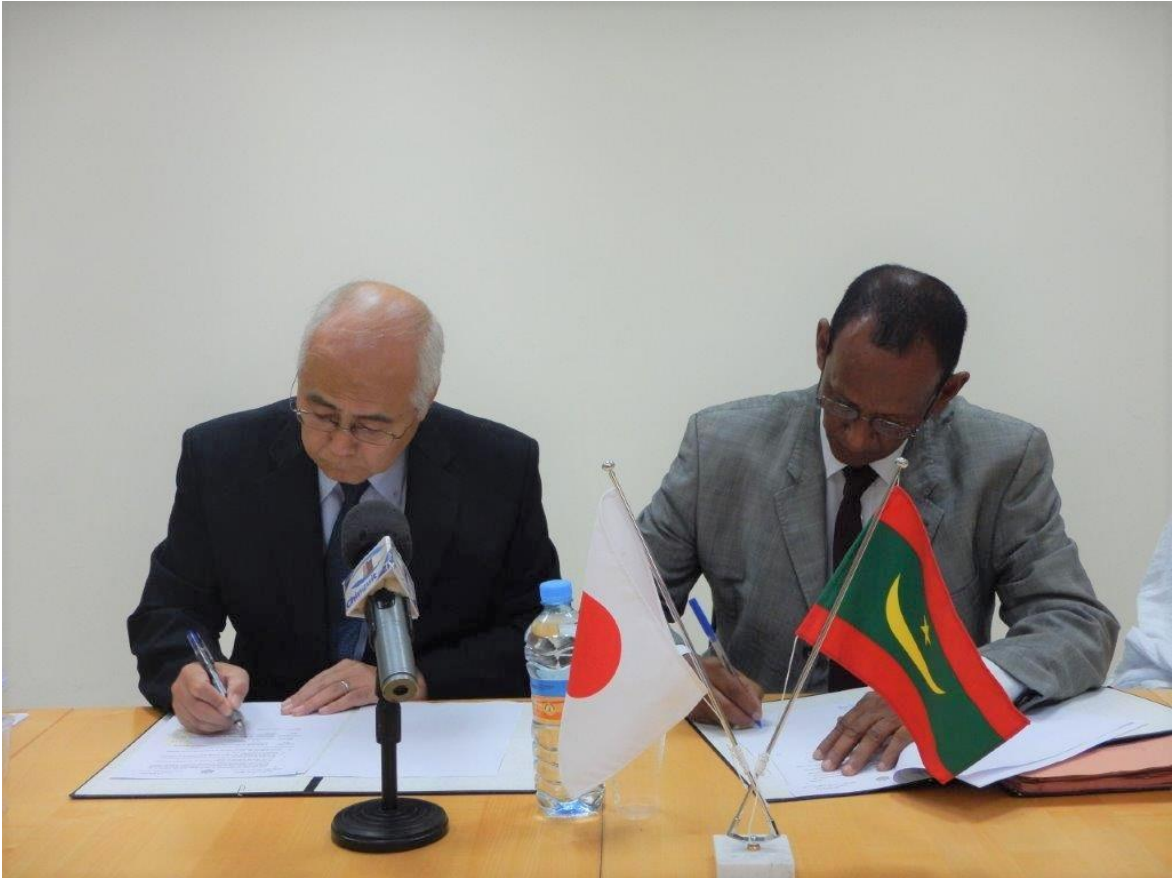
Signature au Contrat de Don