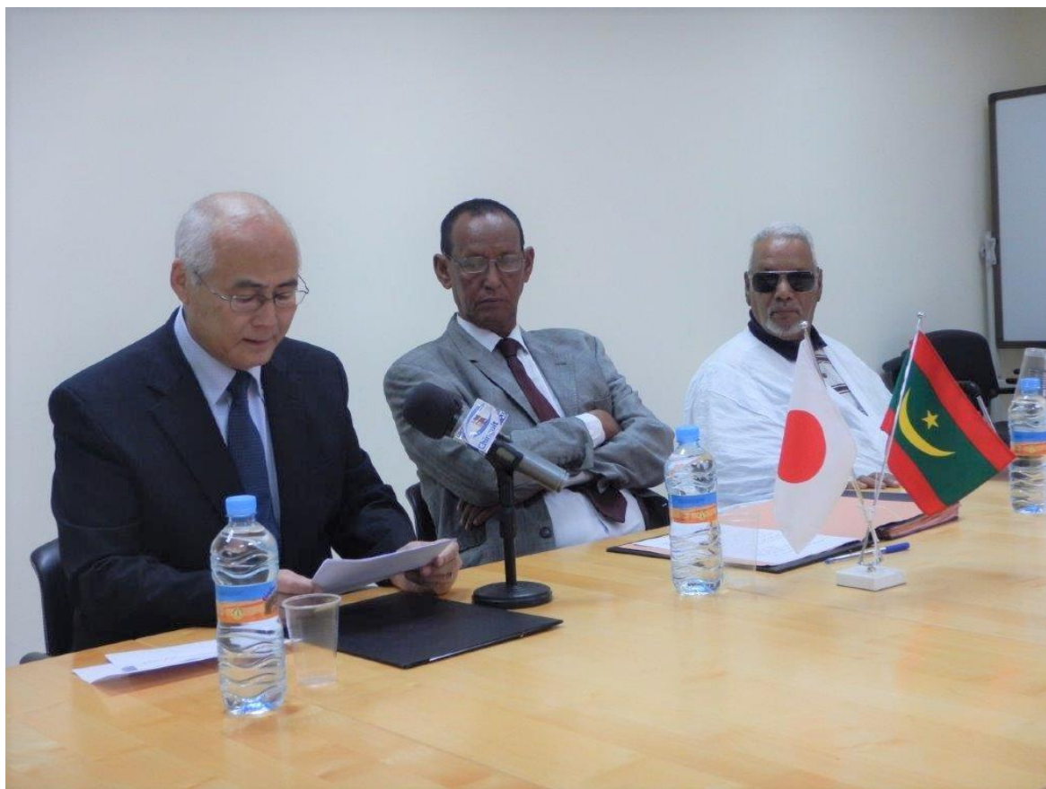
Discours de Son Excellent Monsieur EHARA Norio