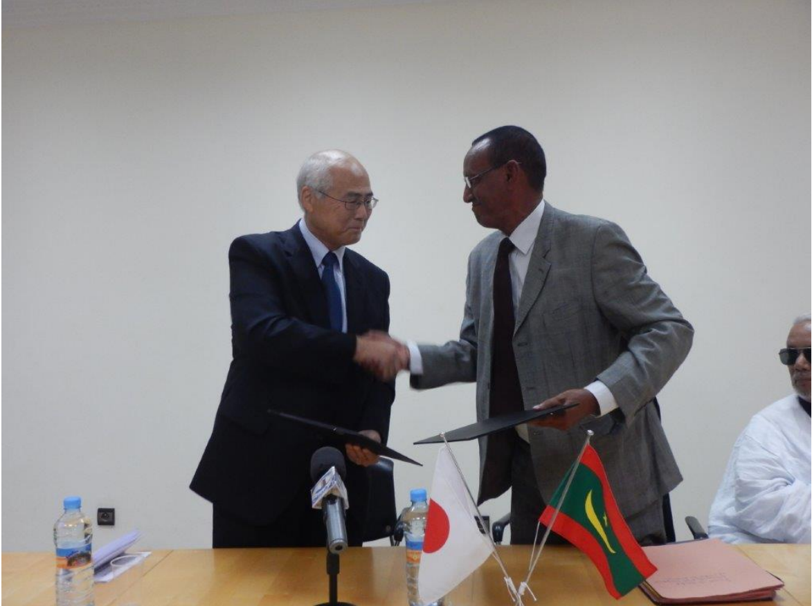
Echange du Contrat de Don